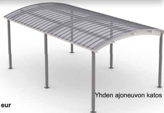
Yhden ajoneuvon katos