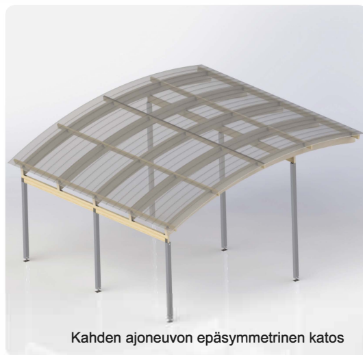
Kahden ajoneuvon epäsymmetrinen katos